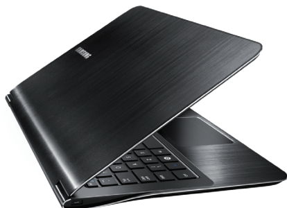
Корпус выполнен из дюралюминия — прочного и легкого металла

Работать в VIP-классе — мечта любой компании, ибо это автоматически дает высокий бренд-имидж. Но не все способны на это, поскольку требуются серьезнейшие вложения в технологические и дизайнерские разработки.